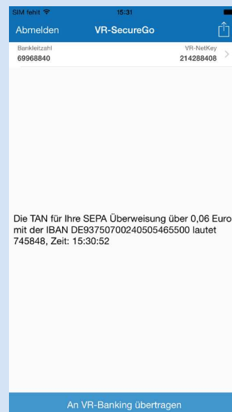
App der iOS-Version, App anderer Betriebssysteme geringfügig anders.